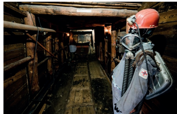
Deutsches Erdölmuseum ± 13,0 km