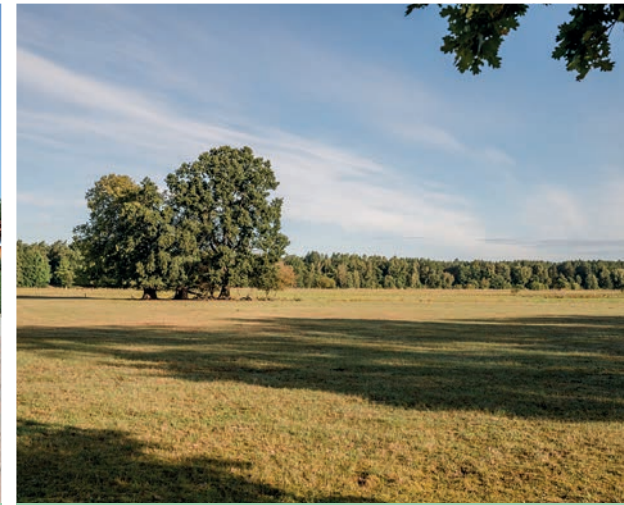
Hornbosteler Hutweide ± 9,6 km