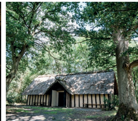
Historische Waldschmiede ± 26,0 km