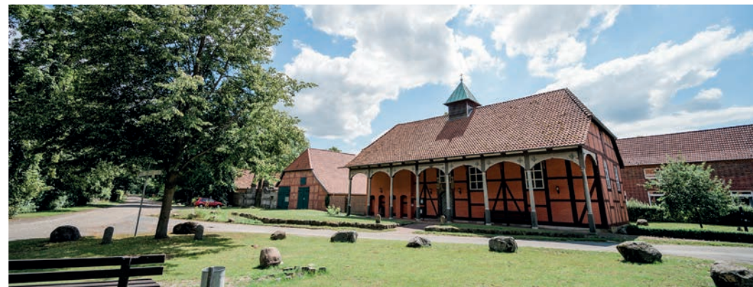
Stechinelli-Kapelle ± 31,4 km