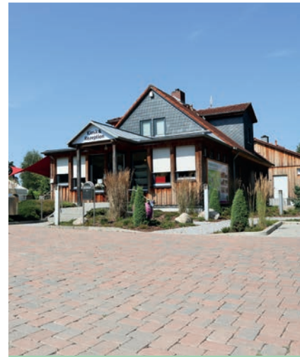
Startpunkt Campingpark Starting Point

the Hornbosteler Hutweide its unique character. In the „German Petroleum Museum“ in Wietze you will gain impressions of the development of oil extraction. A restored cobblestone trade route takes you to the „forest forge“. Bog iron ore used to be smelted here. The Stechinelli chapel in Wieckenberg, district of Wietze, invites you to visit.